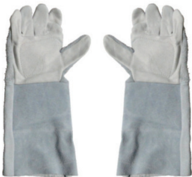
8990.450.6 - Luvas Vaqueta/Raspa Curta 8990.450.7 - Luvas Vaqueta/Raspa Longa