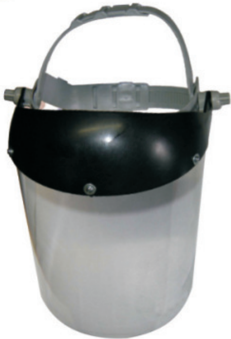
8990.108 Protetor Facial 8" s/ Catraca 8990.108.2 Protetor Facial 8" s/ Catraca Verde