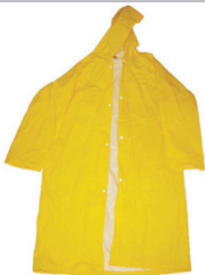
8990.59 Capa p/ Chuva Tam. G