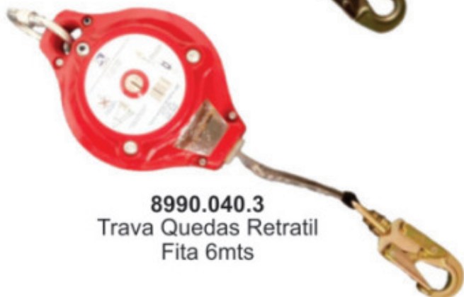
8990.040.3 Trava Quedas Retratil Fita 6mts