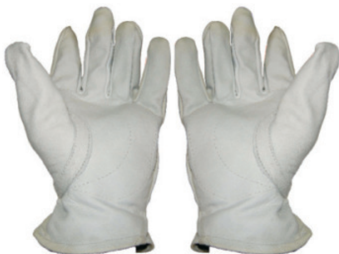
8990.450.33 Luva Vaqueta 24cm (Par)