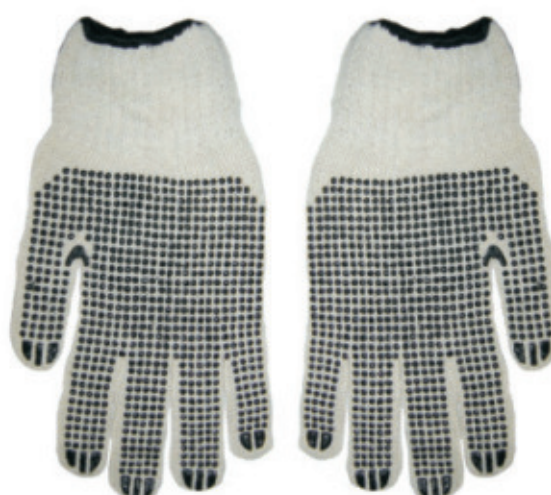
8990.400.1 Luva Pigmentada (Par)