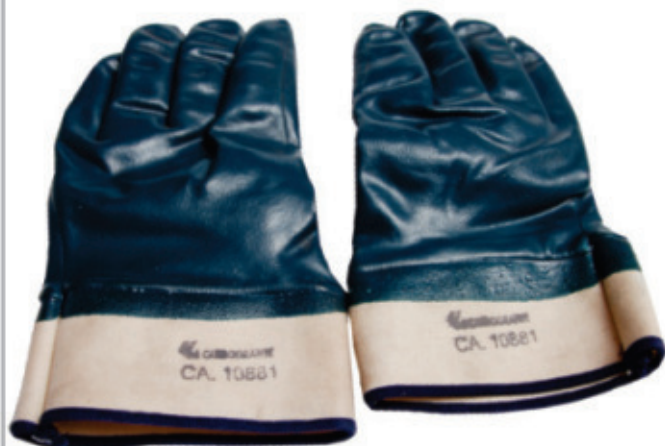
8990.194.1 Luva Nitrilica Hercules