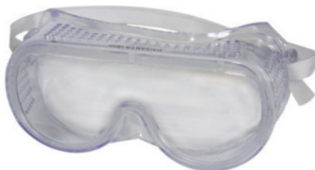
8990.102.1 Óculos Ampla Visão Perfurado