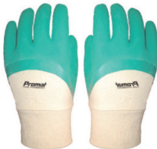
8990.203.1 Luva Malha Emborrachada Nitrilon Volk