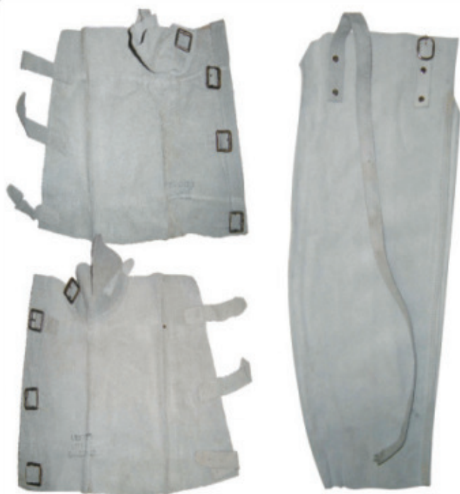
8990.87 Perneira Raspa