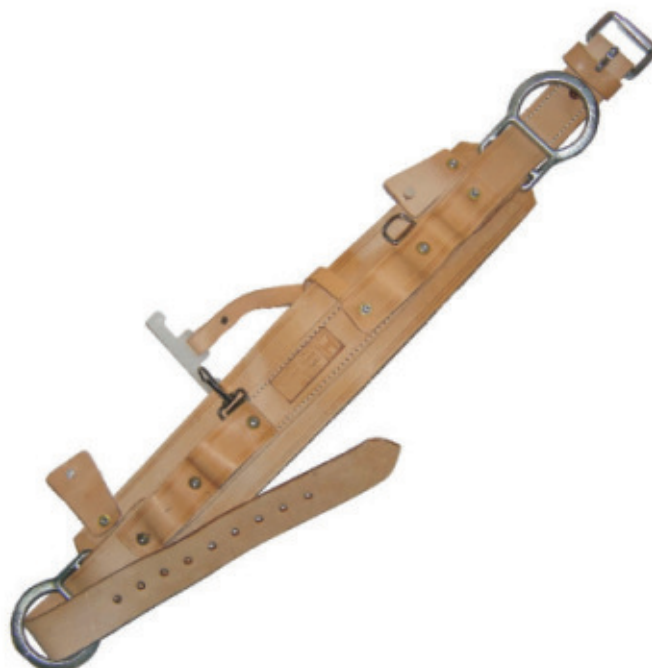
8990.301.1 Cinto de Couro p/ Eletricista Tamanho 22