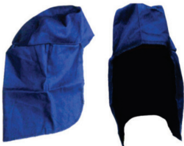
8990.84 - Bone árabe velcro 25 Cm