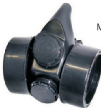
8990.11 Máscara Respiratória CG - 306