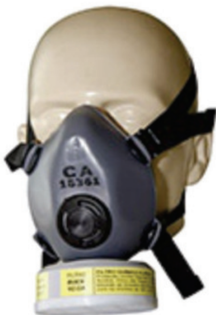
8990.11.2 Máscara Respiratória 1 Filtro