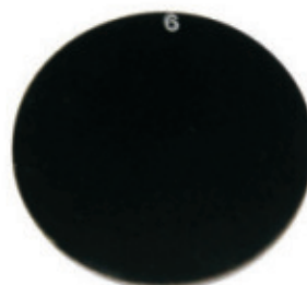
8990.105 Lente Redondo Óculos