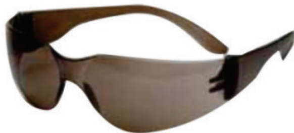
8990.200.014 - Incolor 8990.200.015 - Fumê Óculos Protetor SS2 Super Safety