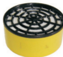
8990.11.6 Filtro RC - 203