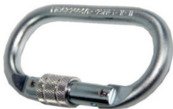
8990.42 Mosquetão Oval Com Rosca