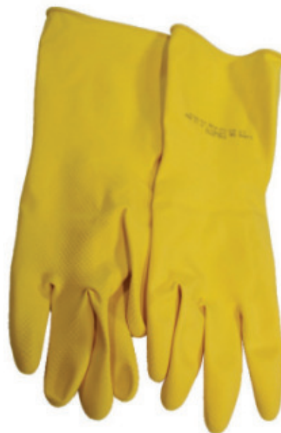
8990.401.10 - Luva Látex Médio 8990.401.11 - Luva Látex Grande 8990.401.12 - Luva Látex Pequena 8990.401.13 - Luva Látex Extra Grande