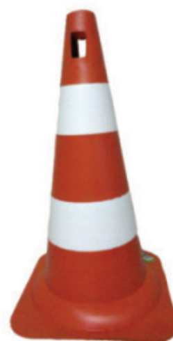
8990.50.1 Cone de Sinalização 50cm Laranja/Branco