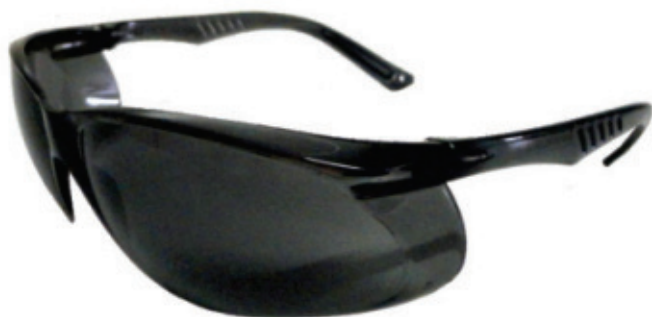
8990.200.005 - Incolor - SS5 Super Safety 8990.200.006 - Cinza - SS5 Super Safety