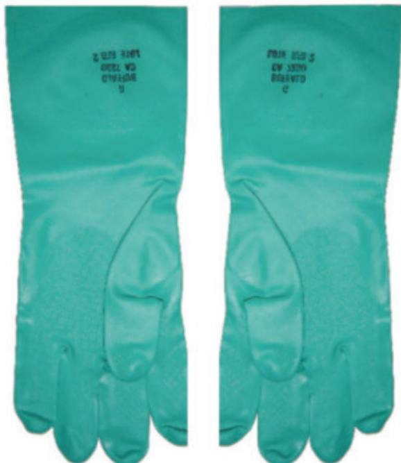
Luva Nitrilica Verde (PAR)