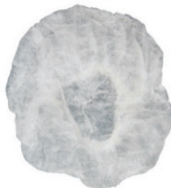
8990.90 Touca Descartável