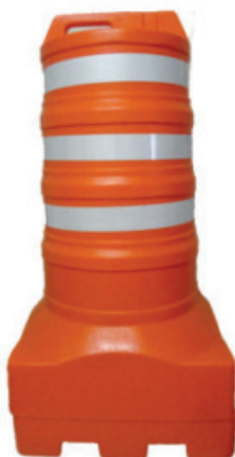
8990.50.6 Cone Canalizador de Tráfego Base Quadrada 110cm Laranja/Branco