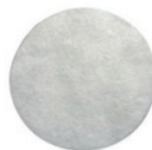
8990.11.5 Pré - Filtro PF - 5