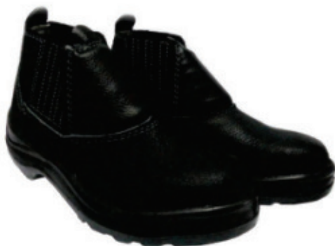
Calçados de segurança C/ bico em pvc Marluvas