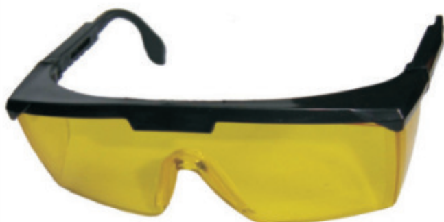
8990.101 - Ambar 8990.102 - Incolor 8990.107 - Cinza 8990.112 - Verde