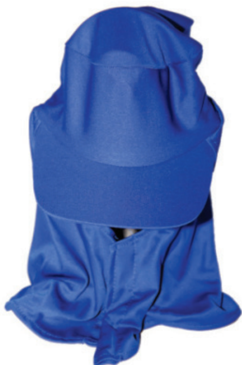
8990.85.1 - Boné árabe de helanca azul