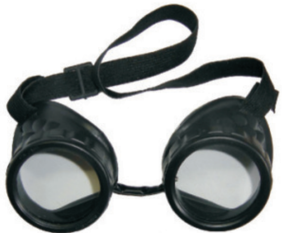
8990.109 Óculos de Solda