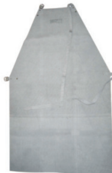
8990.221.1 Avental de Raspa c/ Emenda