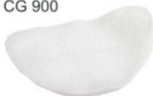
8990.900.1 Filtro P/ MASCÁRA CG 900