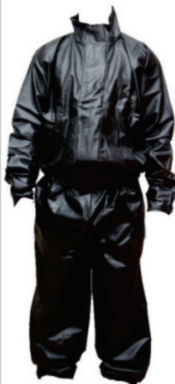
8990.58 Conjunto Para Chuva Tam.G