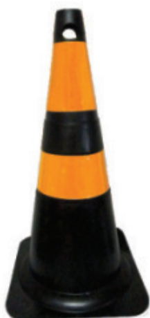
8990.50 Cone de Sinalização 50cm Amarelo/Preto