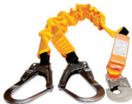
8990.042 Talabarte em Y com Absorção de Impacto