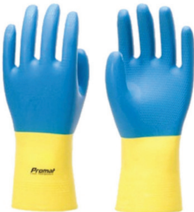
Luva Latex (PAR)