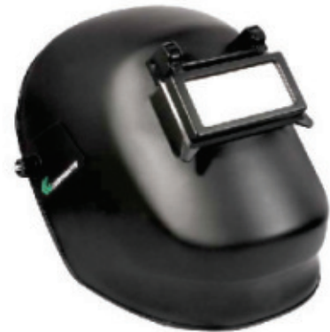
8990.103.2 Máscara p/ Solda c/ Cabo