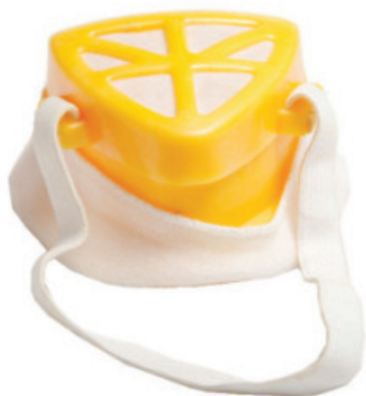
8990.900 Mascara P/ Poeira CG 900