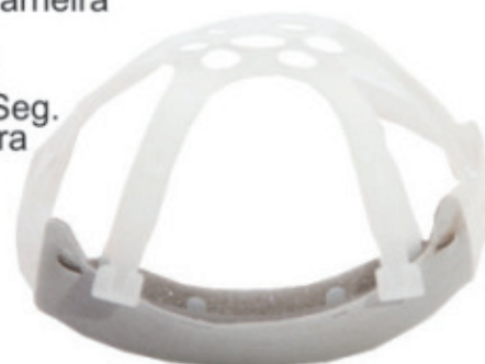
8990.121.9 Aranha para capacetes