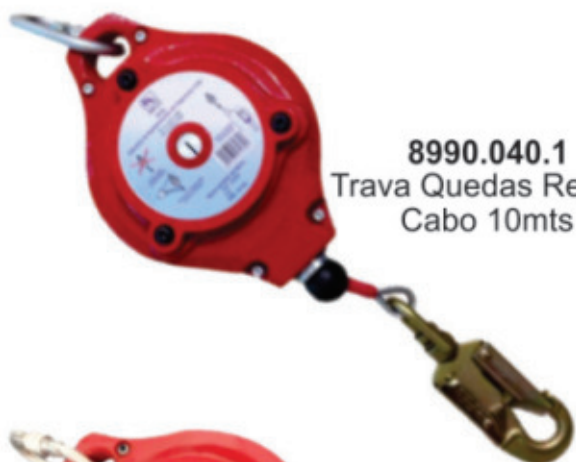
8990.040.1 Trava Quedas Retratil Cabo 10mts